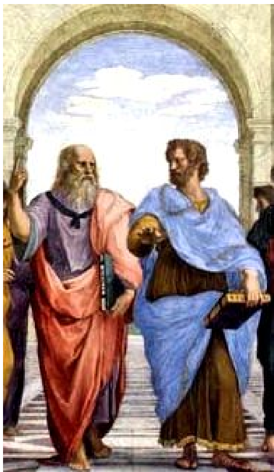
Raffaello «Scuola d'Atene» «Platone e Aristotele» Stanze vaticane

«Questa non è più l'epoca delle lotte tra platonici ed aristotelici; quanto deve emergere nell'epoca attuale da queste correnti è il contenuto profondo che le attraversa: l'Antroposofia, l'evento del Cristo».