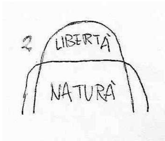
Disegno 2 (libertà in rosso)

Archiati. Non in quanto padre, in quanto madre, ma in quanto spiriti umani uguali a tutti gli altri. L'affinità di sangue -naturalmente c'è in tutti noi- e l'affinità spirituale, quando noi poniamo la domanda: "Ma non possiamo averle tutte e due"? Certo che si possono avere tutte e due. La domanda non si riferisce in generale a tutte e due, si riferisce a quale delle due ha la guida, quale delle due è determinante. Se è determinante l'amore libero il sangue si fa da strumento, non è che il sangue sparisca però si fa da strumento. Un conto è vivere tutto ciò che è di sangue, di tradizione, di gruppo ecc. come strumento per far emergere ciò che è individuale -tutto ciò che è di natura, compreso il sangue, ben venga, ci vuole, perché senza il sostrato di natura non c'è nulla dell'uomo-, un conto è che l'uomo si riduca a questo fatto di natura e non abbia altro, non costruisca altro, e un altro conto è se su questa natura costruisce tutto un mondo, che è quello della libertà, allora è quest'ultimo fattore ad essere determinante.